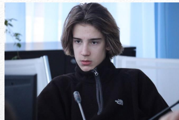
П р а в н у к и